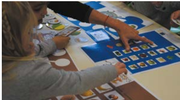
Jeu des marmites créé à l'occasion de la Semaine du Goût 2016

Mais la pomme n'est pas seulement un fruit, c'est au cours de l'Histoire devenu un mythe, un symbole et aussi un objet régulièrement mis en scène par les peintres. Cette semaine pourra également permettre de sensibiliser les enfants à l'art en utilisant l'angle de la pomme et son étude.