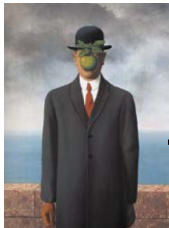
Le fils de l'Homme, Magritte, 1964