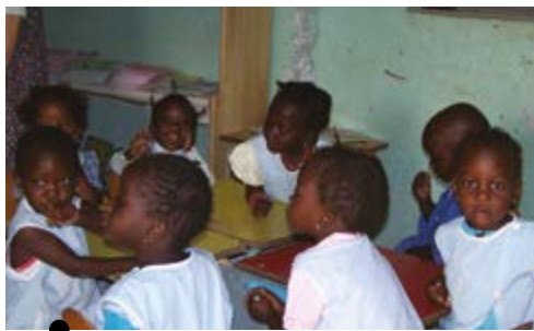
Réponses au Sénégal agit pour la scolarisation d'un maximum d'enfants