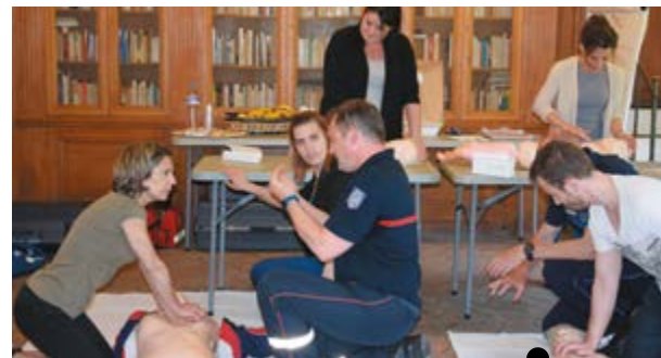
Formation aux gestes de 1 er secours du 4 juin 2018