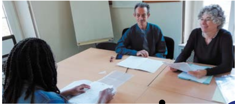
Permanence juridique de la LDH à la Maison des Associations