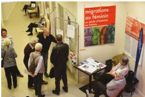
Exposition "Accueillons les réfugiés" à la Maison Jacques Tati dans le Cadre de Festisol 2017

Zoom sur les grandes rencontres qui rythmeront ces deux semaines (mais il y en aura beaucoup d'autres : rendez-vous dans le sOrtir de ce mois pour y faire votre marché).