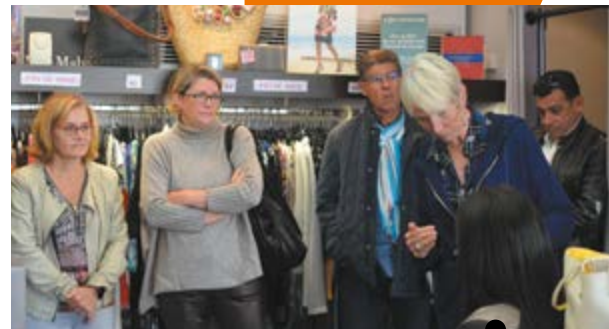
Formation à la prévention situationnelle du 24 septembre 2018

● Plus d'infos sur le CLSPD sur www.mairie-orsay.fr (rubrique Prévention et sécurité)