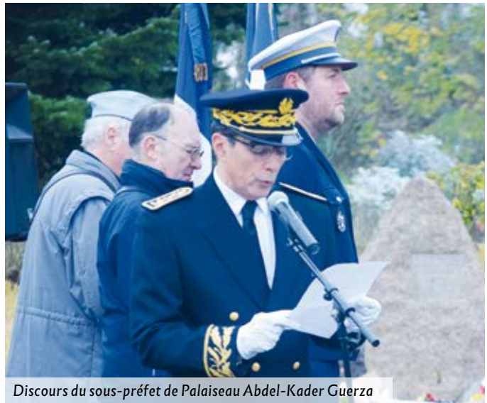
Discours du sous-préfet de Palaiseau Abdel-Kader Guerza