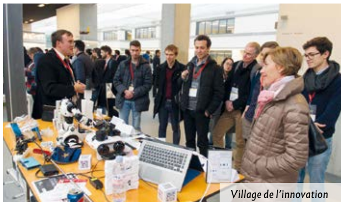
Village de l'innovation

C'est dans l'auditorium flambant neuf de CentraleSupélec que s'est tenue la 3ème édition du TEDx Saclay le 30 novembre dernier. Plus de 1000 personnes ont assisté aux conférences données par des intervenants prestigieux sur le thème « au service du vivant ». Le village de l'innovation organisé tout au long de la journée a également conquis un public venu nombreux pour des « expériences utilisateurs » inédites.