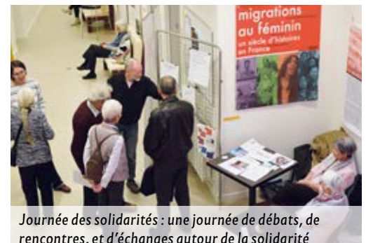
Journée des solidarités : une journée de débats, de rencontres, et d'échanges autour de la solidarité