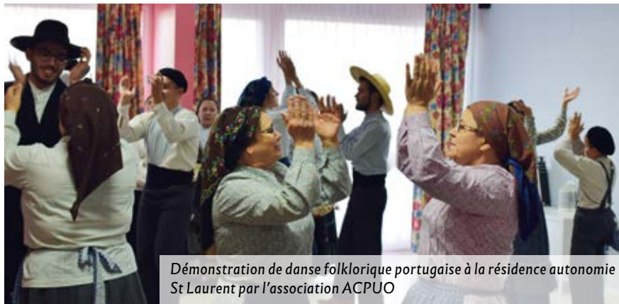
Démonstration de danse folklorique portugaise à la résidence autonomie St Laurent par l'association ACPUO

Rendez-vous pour la prochaine édition du 16 novembre au 2 décembre 2018 !