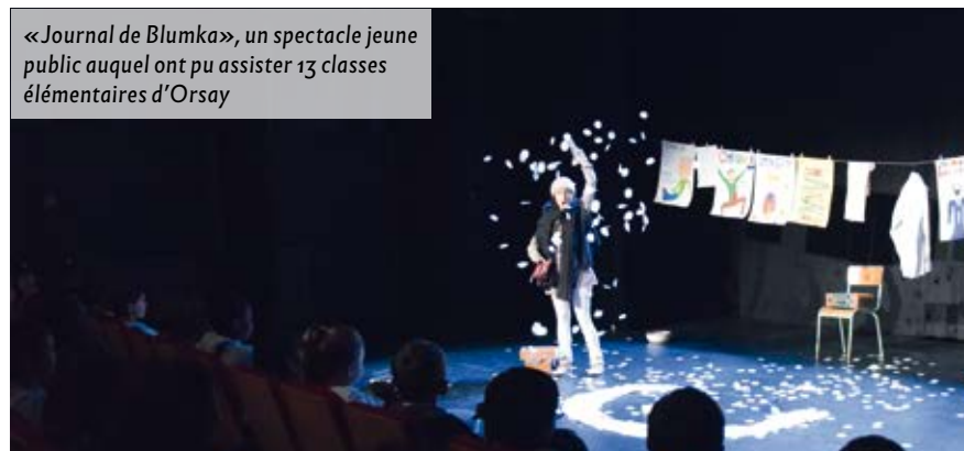
« Journal de Blumka », un spectacle jeune public auquel ont pu assister 13 classes élémentaires d'Orsay