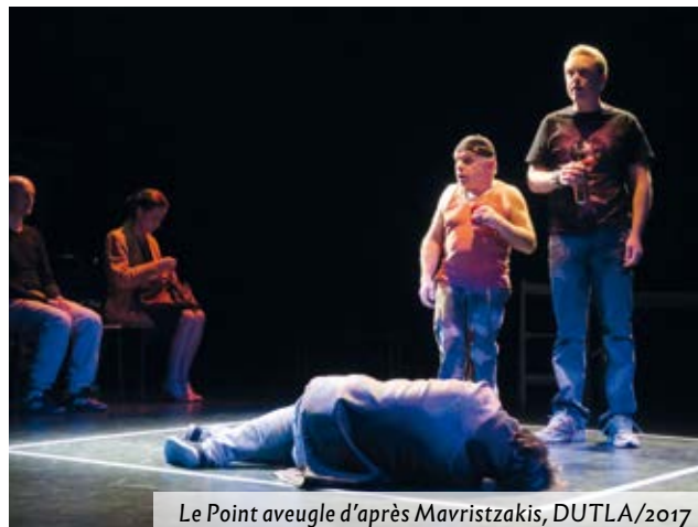
Le Point aveugle d'après Mavriatzakis, DUTLA/2017

Vous avez envie de vivre une expérience théâtrale? Inscrivez-vous aux ateliers, venez aux rencontres et aux débats ou assistez aux spectacles !