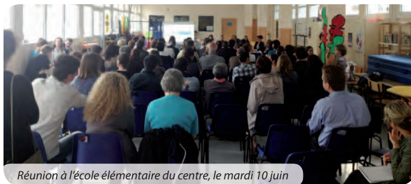
Réunion à l'école élémentaire du centre, le mardi 10 juin

Après plus d'un an et demi de travail et de concertation, la réforme des rythmes scolaires sera appliquée à Orsay dès septembre prochain. Des réunions d'information ont été organisées par la mairie pour présenter dans le détail la nouvelle organisation périscolaire aux parents d'élèves. Des rendez-vous suivis qui ont confirmé l'intérêt constructif des parents et des acteurs du projet.