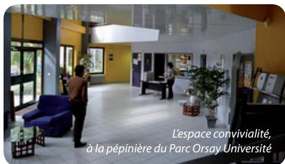
L'espace convivialité, à la pépinière du Parc Orsay Université

La Caps – Communauté d'agglomération du plateau de Saclay – en partenariat avec l'Agence pour l'Economie en Essonne, organise des rencontres avec les créateurs d'entreprises pour les aider dans leur projet, sous deux formes.