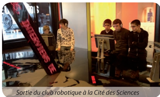
Sortie du club robotique à la Cité des Sciences

Inscription à l'année : 20€ de septembre à juin. Reprise le 18 septembre. Nouveauté : mise en place de stages durant l'année. / Moins de 5h : 5€ / Plus de 5h : 10€