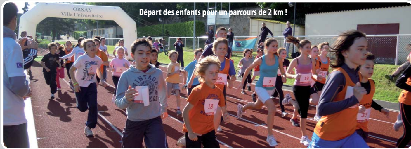
Départ des enfants pour un parcours de 2 km !

Retrouvez toutes les photos et le classement sur www.mairie-orsay.fr