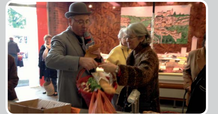
Vendredi 24 mai : musique, biergarten et grande tombola avec paniers garnis offerts par les commerçants du marché !