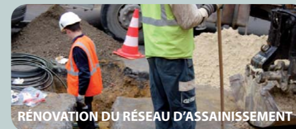
RÉNOVATION DU RÉSEAU D'ASSAINISSEMENT

- Rue Archangé : rue fermée de mi-juillet à début août entre la rue Verrier et la ruelle des Cordiers. Déviation par le boulevard Dubreuil. Stationnement maintenu sur un côté de la voirie. - Place de la République - Rue de la Troche : mise en sécurité pour prévenir l'affaissement de la chaussée. La rue sera fermée dans sa partie comprise entre la rue de la Corniche et la rue de Châteaufort dans la première quinzaine de juillet. Une déviation sera mise en place rue Aristide Briand et rue Charles Gounod.