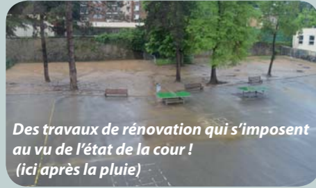
Des travaux de rénovation qui s'imposent au vu de l'état de la cour ! (ici après la pluie)