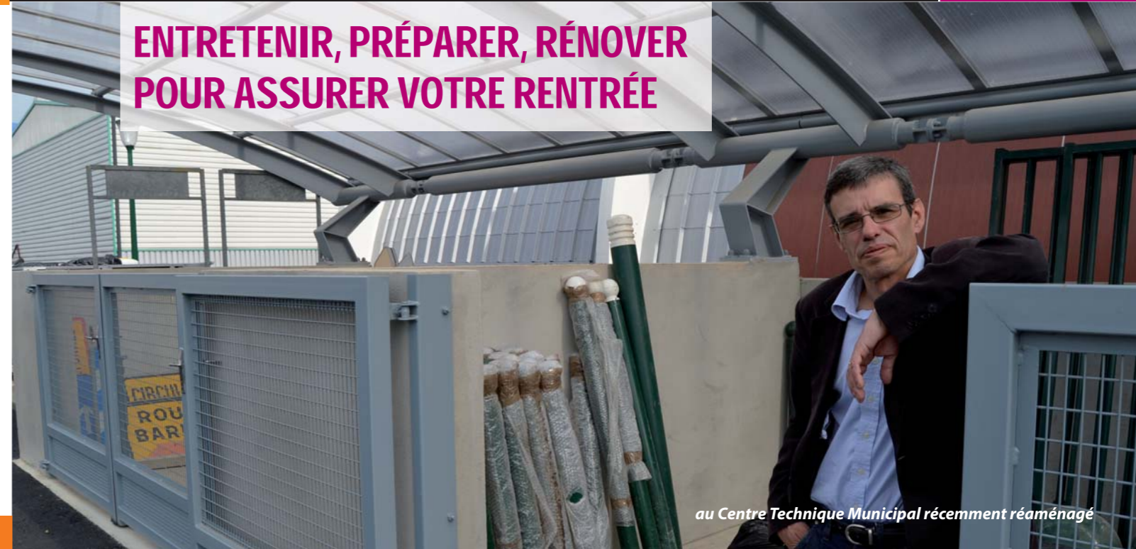
au Centre Technique Municipal récemment réaménagé

ENTREtenir, PRÉPARER, RÉNOVER POUR ASSURER VOTRE RENTRÉE