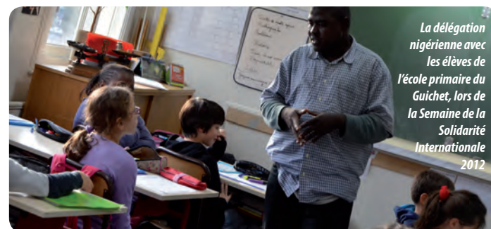
La délégation nigérienne avec les élèves de l'école primaire du Guichet, lors de la Semaine de la Solidarité Internationale 2012