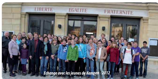
Echange avec les jeunes de Kempen - 2012