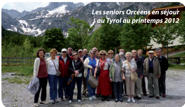
Les seniors Orcéens en séjour au Tyrol au printemps 2012

Le Centre Communal d'Action Sociale de la ville propose aux seniors Orcéens de les emmener en croisière en Méditerranée du 23 au 30 juin prochains. Dépêchez-vous, le nombre de places est limité et le tarif négocié par la mairie très attractif !