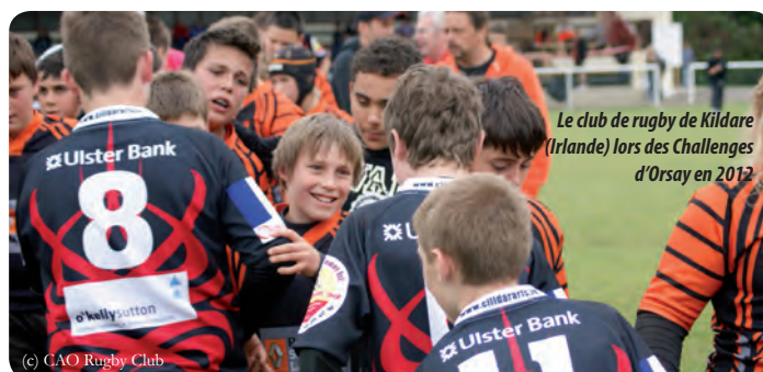
Le club de rugby de Kildare (Irlande) lors des Challenges d'Orsay en 2012