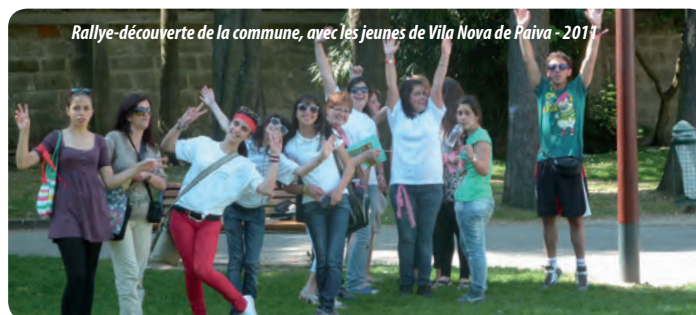
Rallye-découverte de la commune, avec les jeunes de Vila Nova de Paiva - 2011