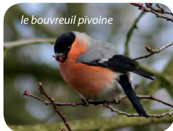
le bouvreuil pivoine

■ SAMEDI ET DIMANCHE 1 ET 2 JUIN DE 14H À 18H. BOIS DE LA GRILLE NOIRE ENTRÉE RUE DE PARIS, FACE À LA RUE D'ORGEVAL GRATUIT, ACCESSIBLE À TOUS, OUVERT TOUTE L'ANNÉE CATHERINE PAROCHE : 01 64 46 59 75 / LHS91.FREE.FR HTTP://LESHERBESSAUVAGES.FREE.FR