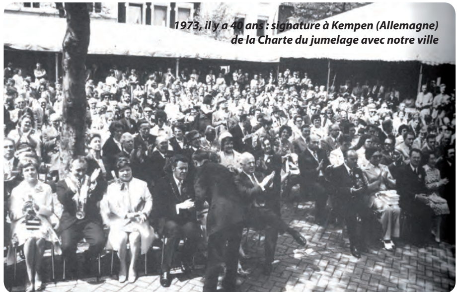
1973, il y a 40 ans : signature à Kempen (Allemagne) de la Charte du jumelage avec notre ville

Au programme, cérémonie officielle, rencontres, manifestations culturelles et ludiques agrémenteront ce weekend particulier au cœur du centre-ville. Si pour certains, ces échanges existent déjà... ce sera peut-être pour d'autres, l'occasion de nouvelles rencontres ! Samedi 1 er juin, la ville et la délégation