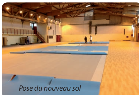
Pose du nouveau sol