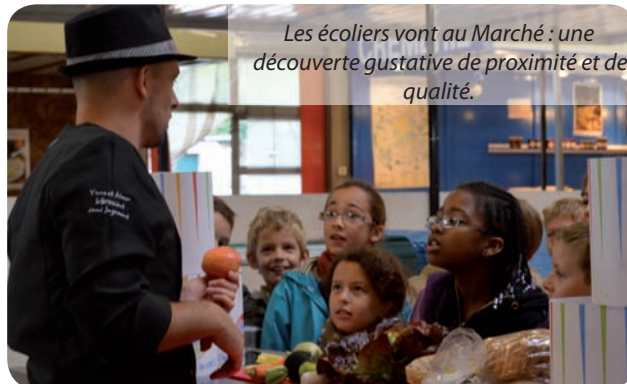
Les écoliers vont au Marché : une découverte gustative de proximité et de qualité.

L'éveil au goût passera pour les élèves par la visite du marché, la découverte des étals et des métiers de bouche. Les papilles seront aussi à l'honneur avec un atelier culinaire animé par un chef cuisinier, organisé pour les enfants auprès des commerçants. Et pour finir, chacun des enfants repartira avec un panier garni, composé de fruits et légumes ... du marché bien sûr ! De quoi écarquiller les pupilles et ravir les papilles.