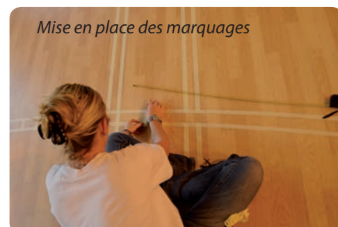
Mise en place des marquages