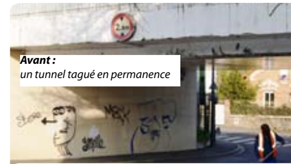
Avant : un tunnel tagué en permanence