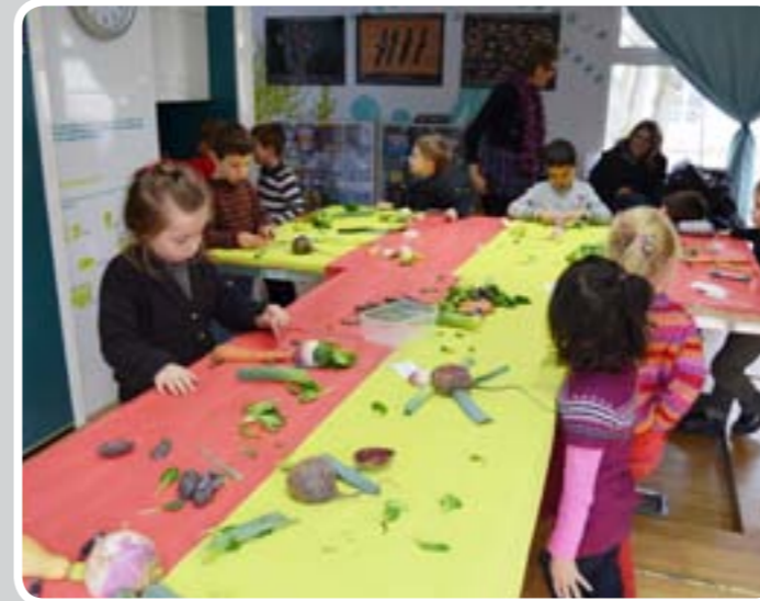
Les enfants des centres de loisirs maternels ont participé à l'animation du jeu collectif "le chemin de table" le mercredi 6 février dernier.

Après le thème de l'énergie en 2012, le thème choisi en 2013 est l'eau (en lien avec l'Année internationale de la coopération dans le domaine de l'eau).