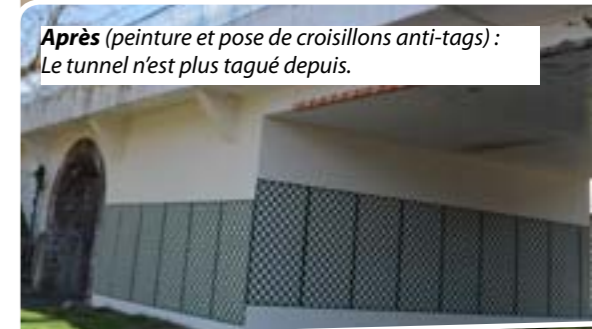
Après (peinture et pose de croisillons anti-tags) : Le tunnel n'est plus tagué depuis.