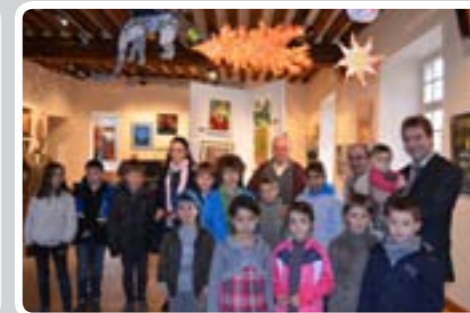
Atelier de l'ASO