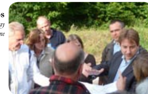
Rencontre sur le terrain avec les habitants de la rue d'Orgeval

et vice-président du Conseil général de l'Essonne