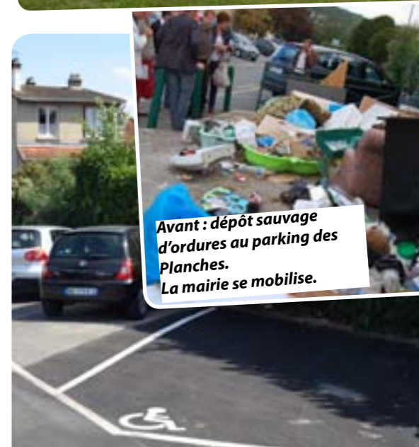
Avant : dépôt sauvage d'ordures au parking des Planches. La mairie se mobilise.