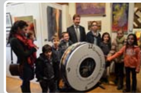
Atelier Les petits gris