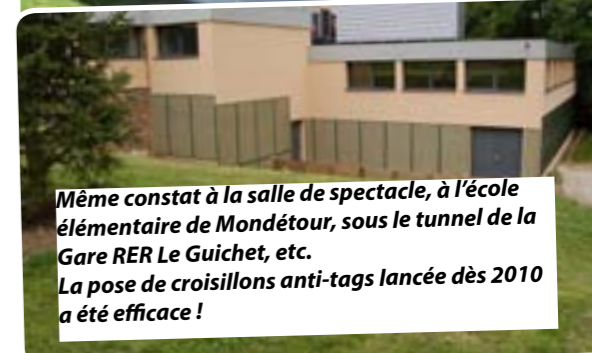
Même constat à la salle de spectacle, à l'école élémentaire de Mondétour, sous le tunnel de la Gare RER Le Guichet, etc. La pose de croisillons anti-tags lancée dès 2010 a été efficace !