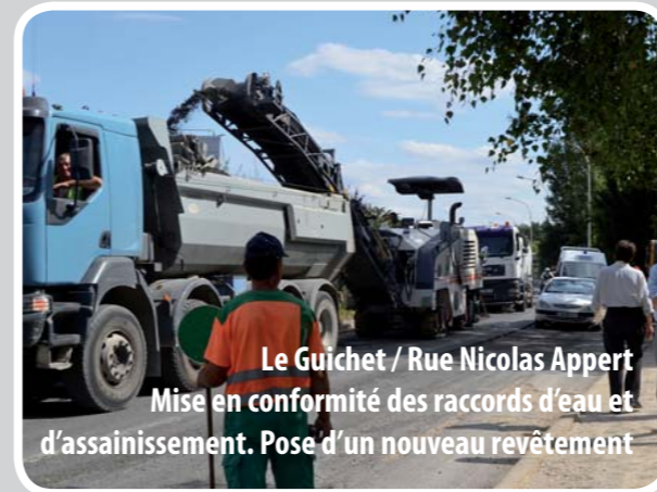
Le Guichet / Rue Nicolas Appert Mise en conformité des raccords d'eau et d'assainissement. Pose d'un nouveau revêtement