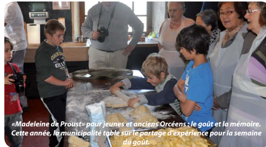
«Madeleine de Proust» pour jeunes et anciens Orcéens : le goût et la mémoire. Cette année, la municipalité table sur le partage d'expérience pour la semaine du goût.

Les seniors ont une place prépondérante dans la vie sociale. Ils sont le repère, l'ancre, le socle sur lequel reposent les nouvelles générations. Sans mémoire, il n'y a pas d'avenir.