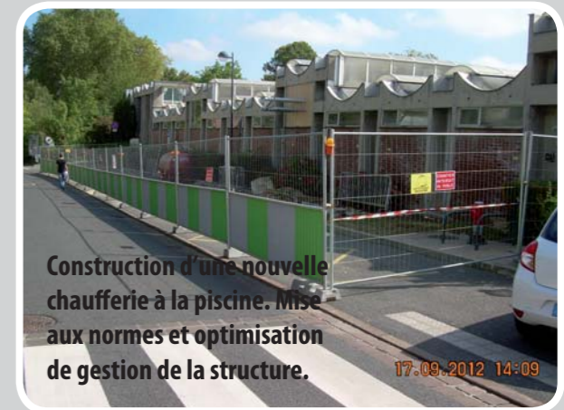
Construction d'une nouvelle chaufferie à la piscine. Mise aux normes et optimisation de gestion de la structure.