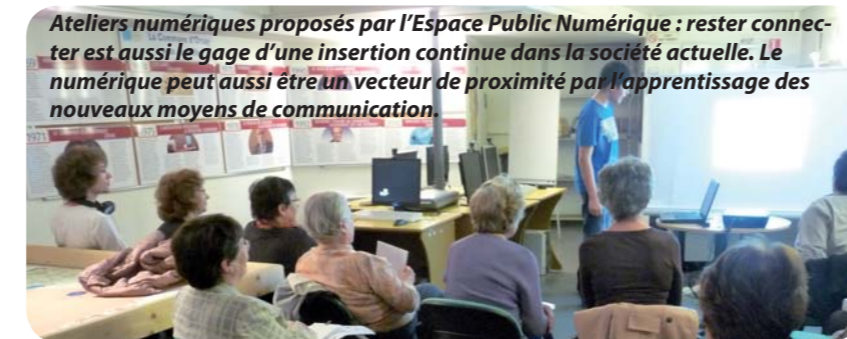
Ateliers numériques proposés par l'Espace Public Numérique : rester connecté est aussi le gage d'une insertion continue dans la société actuelle. Le numérique peut aussi être un vecteur de proximité par l'apprentissage des nouveaux moyens de communication.