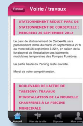
Appli mobile / travaux Pour iPhones et Androids. (vous êtes déjà plus de 1 000 à l'utiliser)

Ces nouveaux medias vous offrent la possibilité de recevoir l'info locale en temps réel. Directement sur votre smartphone ou sur vos fils d'actualité.