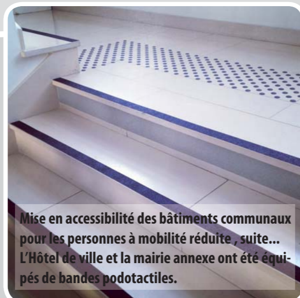
Mise en accessibilité des bâtiments communaux pour les personnes à mobilité réduite, suite... L'Hôtel de ville et la mairie annexe ont été équipés de bandes podotactiles.