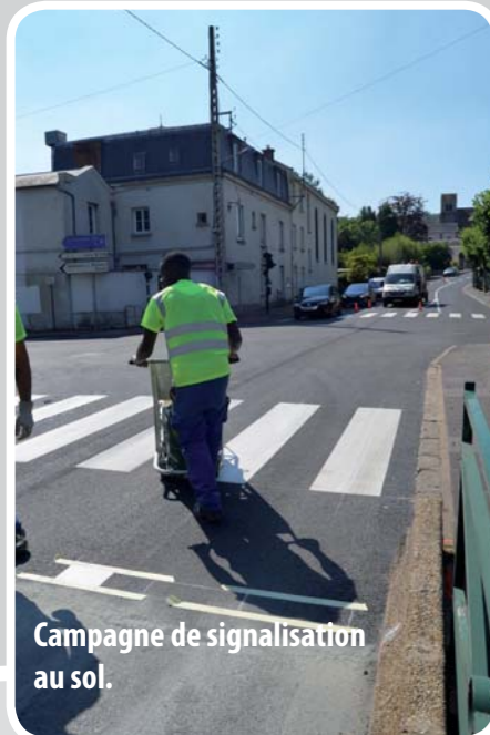
Campagne de signalisation au sol.