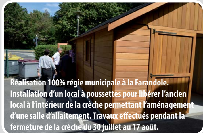
Réalisation 100% régie municipale à la Farandole. Installation d'un local à poussettes pour libérer l'ancien local à l'intérieur de la crèche permettant l'aménagement d'une salle d'allaitement. Travaux effectués pendant la fermeture de la crèche du 30 juillet au 17 août.