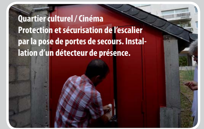
Quartier culturel / Cinéma Protection et sécurisation de l'escalier par la pose de portes de secours. Installation d'un détecteur de présence.