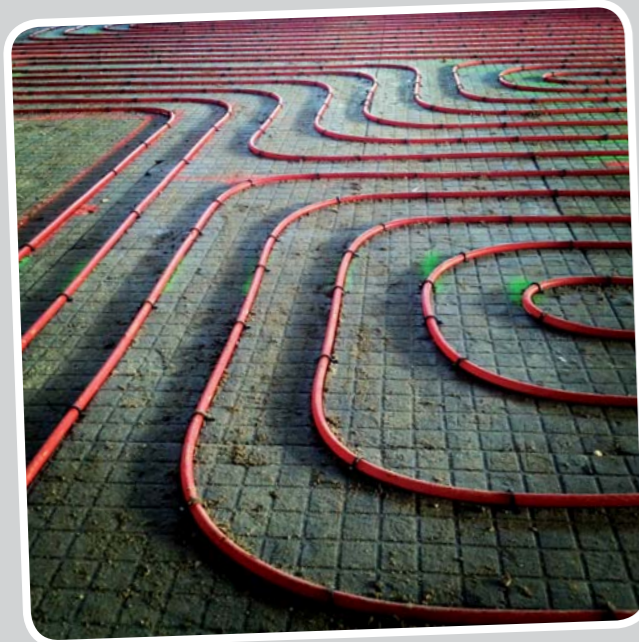
Chauffage au sol pour la salle polyvalente et le club-house. Radiateurs au plafond pour les courts de tennis couverts. Le tout alimenté par deux pompes à chaleur