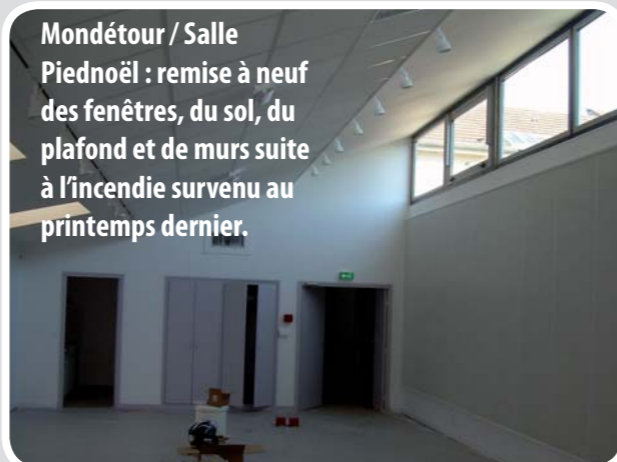
Mondétour / Salle Piednoël : remise à neuf des fenêtres, du sol, du plafond et de murs suite à l'incendie survenu au printemps dernier.