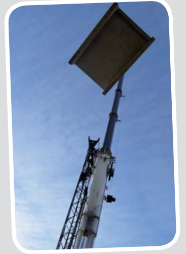
Livraison des modules. Impressionnant.