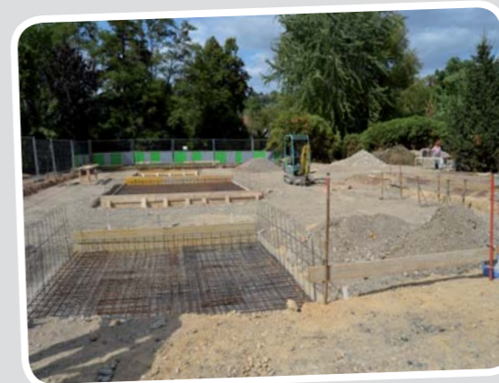
Stade municipal / Nouveau skate-park : il devrait être prêt en octobre !