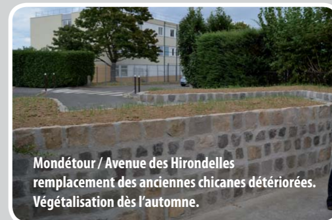
Mondétour / Avenue des Hirondelles remplacement des anciennes chicanes détériorées. Végétalisation dès l'automne.