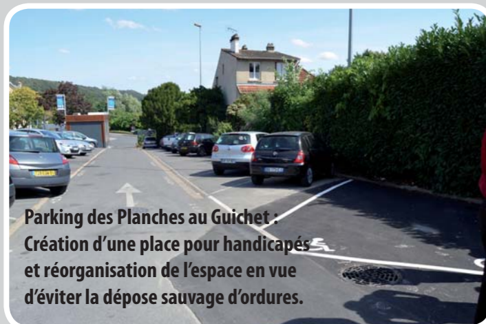
Parking des Planches au Guichet : Création d'une place pour handicapés et réorganisation de l'espace en vue d'éviter la dépose sauvage d'ordures.