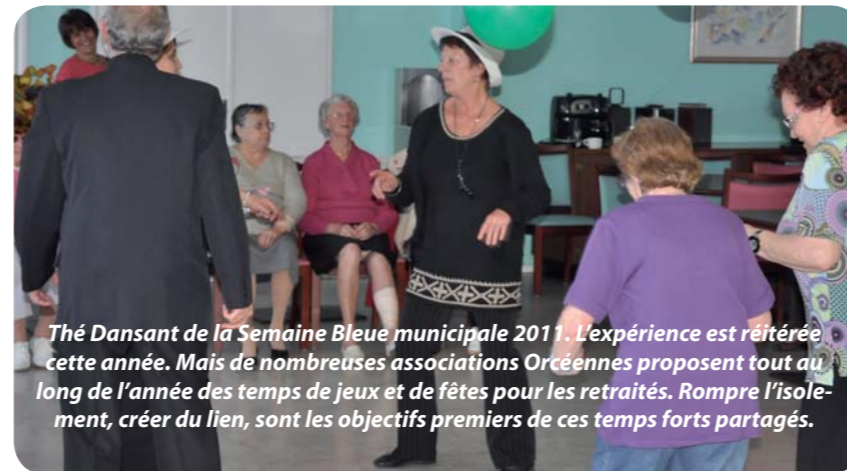
Thé Dansant de la Semaine Bleue municipale 2011. L'expérience est réitérée cette année. Mais de nombreuses associations Orcéennes proposent tout au long de l'année des temps de jeux et de fêtes pour les retraités. Rompre l'isolement, créer du lien, sont les objectifs premiers de ces temps forts partagés.