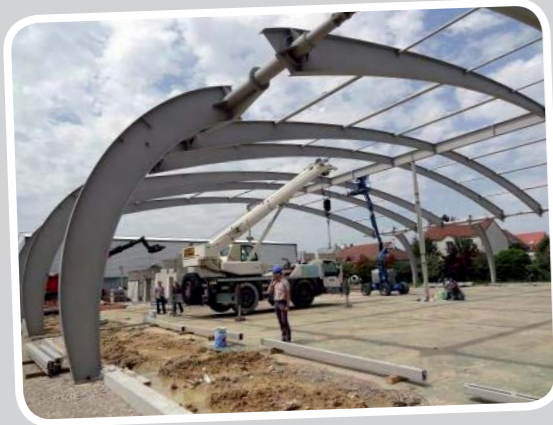
La toiture des tennis couverts sera végétalisée. Une méthode d'isolation alternative et durable.

Complexe sportif de Mondétour : haute qualité environnementale