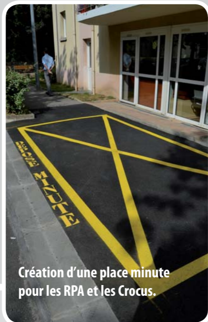
Création d'une place minute pour les RPA et les Crocus.