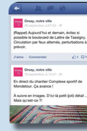
Page Facebook & Compte Twitter Dernières minutes, rappels directement sur votre fil d'actualité