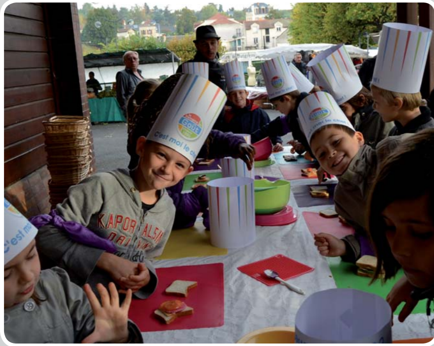
Semaine du Goût 2012 : atelier culinaire le vendredi 19 octobre au Marché du Centre-ville pour une classe de Cm1. Réalisation d'un sandwich club légumes avec zéro déchet !