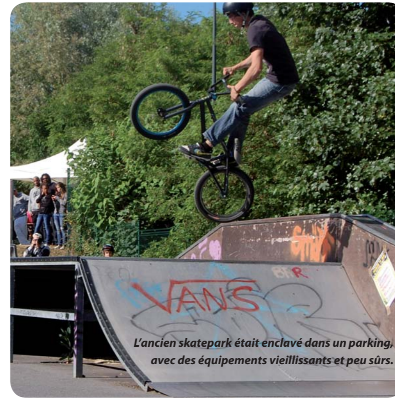
L'ancien skatepark était enclavé dans un parking, avec des équipements vieillissants et peu sûrs.