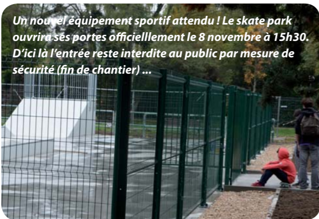
Un nouvel équipement sportif attendu ! Le skate park ouvrira ses portes officiellement le 8 novembre à 15h30. D'ici là l'entrée reste interdite au public par mesure de sécurité (fin de chantier) ...

Avant, les skateurs, trottiriders, patineurs se retrouvaient sur le parking