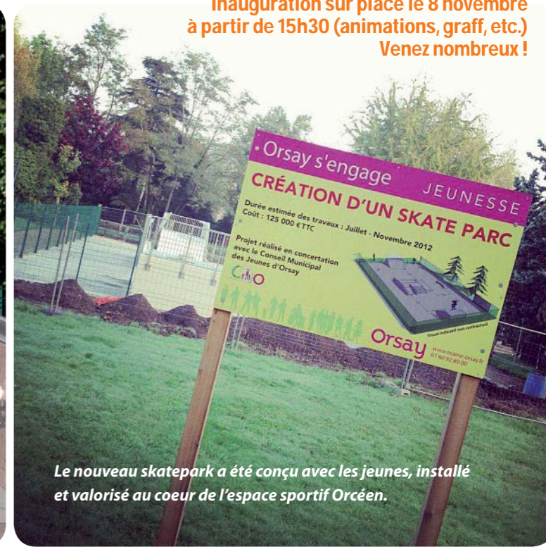
Inauguration sur place le 8 novembre à partir de 15h30 (animations, graff, etc.) Venez nombreux !