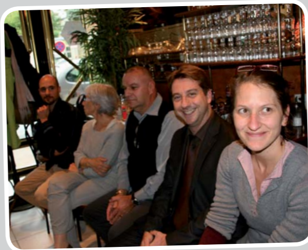
Concours de pâtisserie ! Le jury est en place à l'Aquarelle Café, pour déguster ce que les «gourmands» ont réalisé à l'occasion de l'atelier culinaire intergénérationnel.