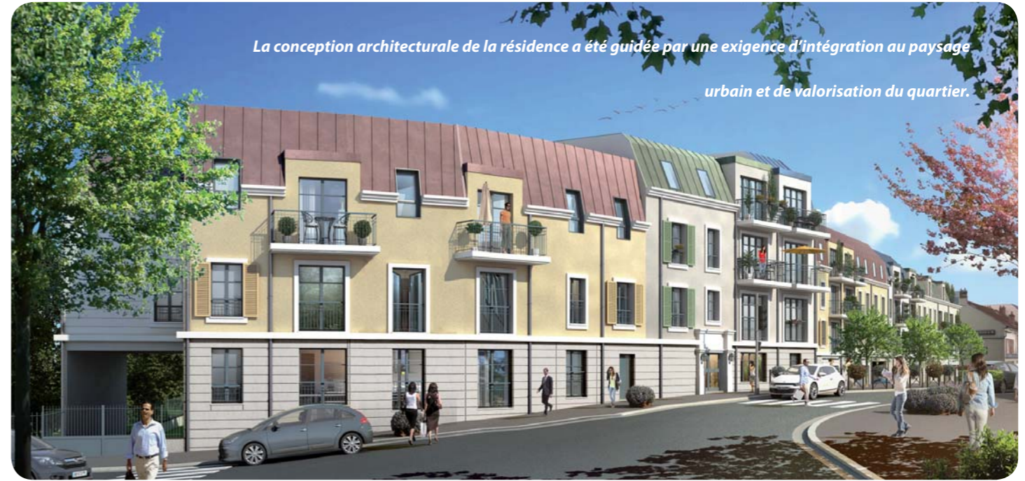
La conception architecturale de la résidence a été guidée par une exigence d'intégration au paysage

Pendant les vacances de la Toussaint : ouverture les mardi 6 et Jeudi 8 novembre de 8h45 à 11h45 Entrée libre - 01 64 46 48 35 / laep@mairie-orsay.fr