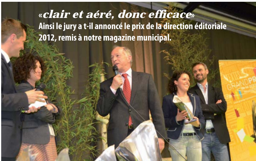
«clair et aéré, donc efficace» Ainsi le jury a-t-il annoncé le prix de la direction éditoriale 2012, remis à notre magazine municipal.

Un véritable succès pour la création de théâtre amateur par la Compagnie La Trappe, coup de cœur du collectif de programmation.