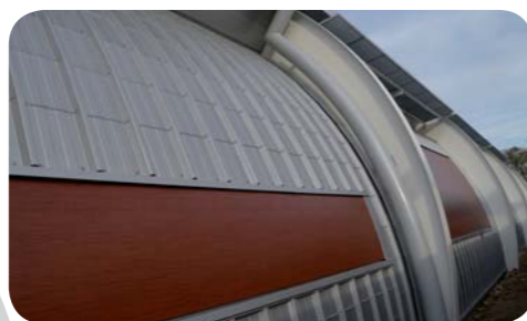
L'ensemble, aux normes PMR (personnes à mobilité réduite), a été réalisé selon des critères Haute Qualité Environnementale (HQE) et bénéficie d'un confort acoustique et thermique optimisé.