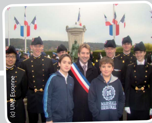
Cérémonie du 11 novembre. Merci à la promotion de l'École Polytechnique et aux jeunes Orcéens pour leur présence.