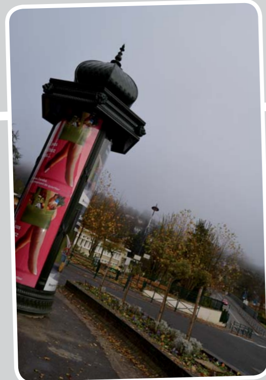
Nouveau ! au Guichet et bientôt à la gare RER Orsay-ville : de véritables Colonnes Morris. Déjà installés aussi, 2 panneaux électroniques : à la mairie-annexe de Mondétour et au bas du parking des Planches au Guichet .