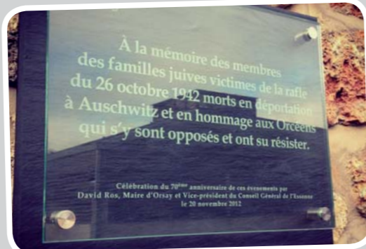
20 novembre • Commémoration et inauguration d'une plaque en mémoire des victimes de la rafle de la vallée de Chevreuse le 26 octobre 1942. Les écoliers d'Orsay ont lu des poèmes en hommage à la Liberté. A voir sur la page Facebook et bientôt sur le site.