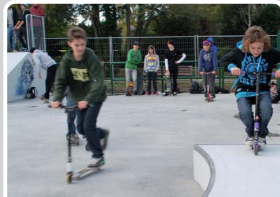
(re)vivez cette après-midi en vidéo sur la chaîne youtube de la ville ! http://www.youtube.com/user/mairieorsay