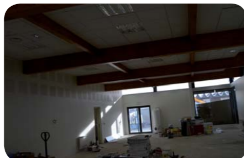
Une nouvelle salle polyvalente (en cours de finition !) et un club-house dans le complexe.