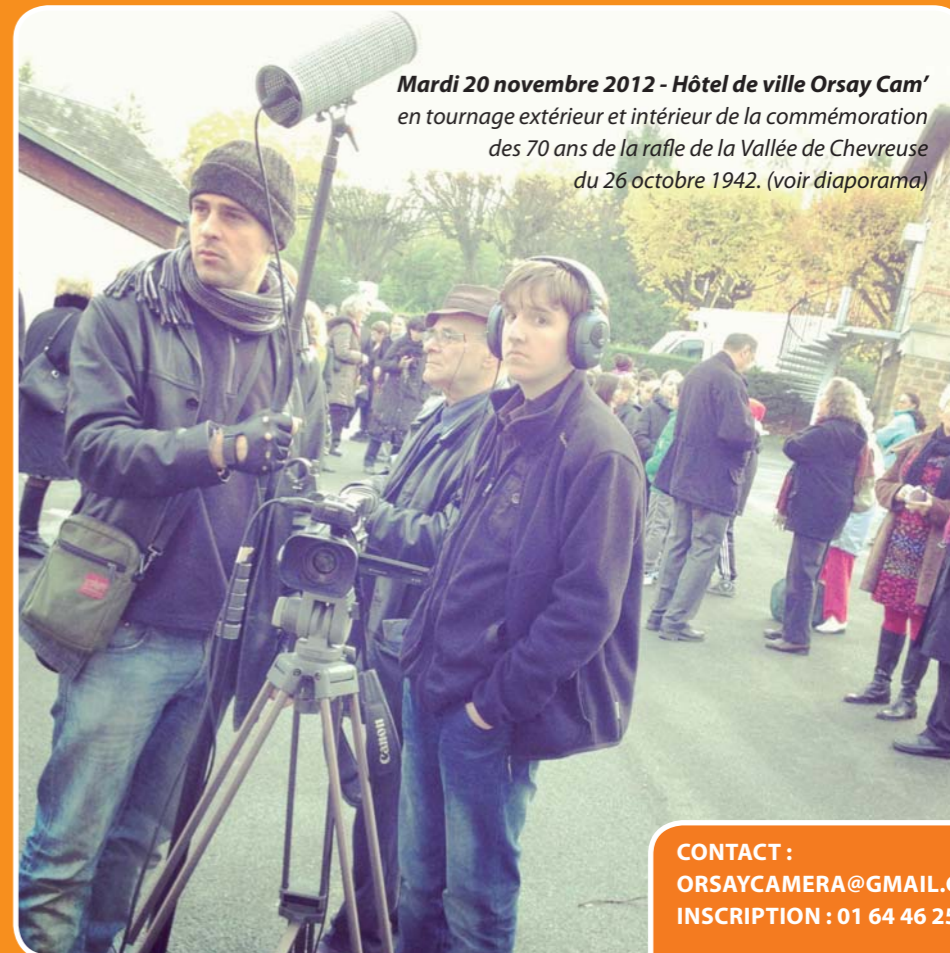
Mardi 20 novembre 2012 - Hôtel de ville Orsay Cam' en tournage extérieur et intérieur de la commémoration des 70 ans de la rafle de la Vallée de Chevreuse du 26 octobre 1942. (voir diaporama)

L'image est notre passion, le film est notre vocation !