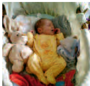
Grégory Dancourt le 4 septembre.