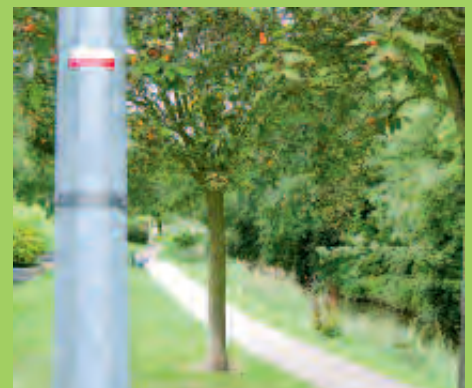
Promenade de l'Yvette, rue Guy Môquet.

Le GR 655-Ouest reprend en grande partie des itinéraires existants, sentiers de grande randonnée ou itinéraires locaux de