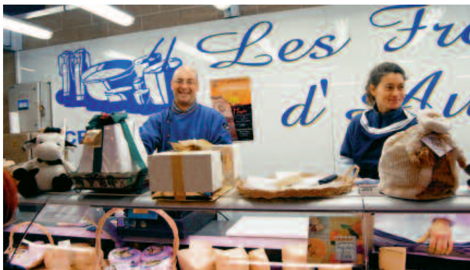
Et félicitation au Gramophone, labellisé Papilles d'Or 2010.