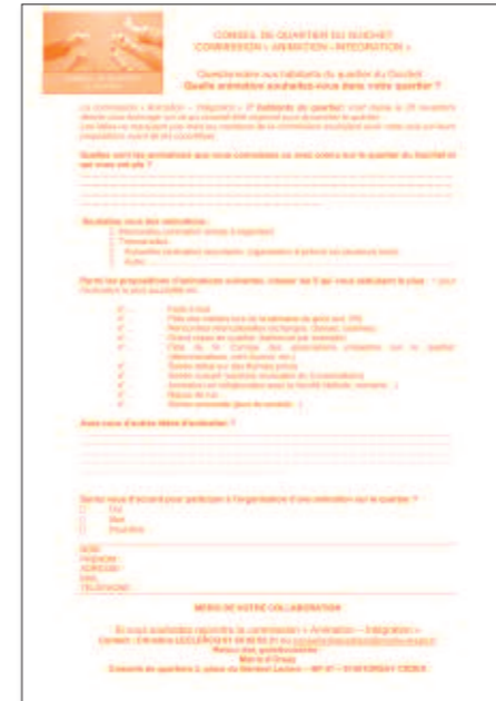
Le Guichet : la commission "animation" lance un questionnaire sur vos attentes. Participez ! Disponible sur www.mairie-orsay.fr

Groupe «Les envoyés spéciaux» (en concert à la K'fet le 5 décembre 2008 faculté d'Orsay)