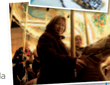
Les commerçants de Comm'Orsay ont fêté comme il se doit l'ouverture d'«Orsay sous les sapins» !