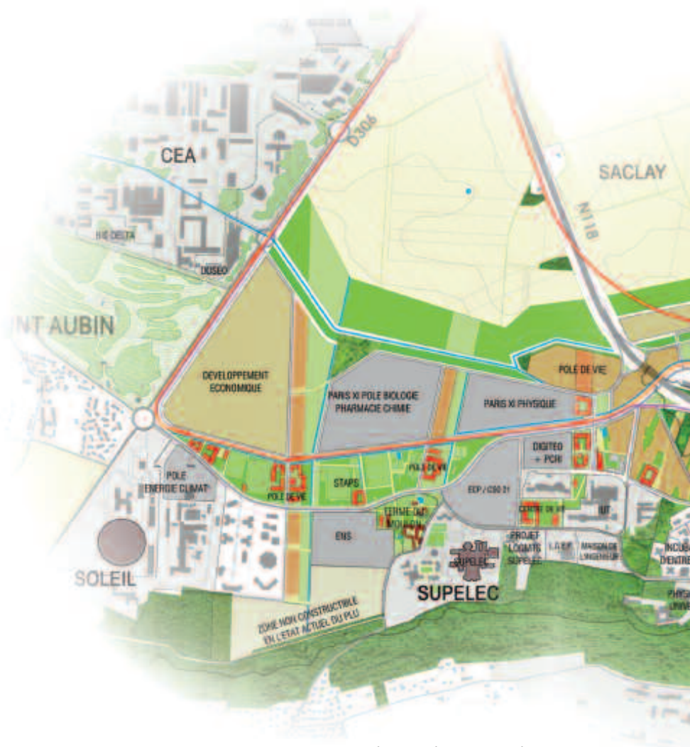
Plan issu du rapport «Plan Campus».

■ Vous trouverez l'ensemble des rapports du plan campus sur www.mairie-orsay.fr .