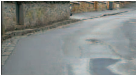
Nids de poule rebouchés rue du Bois des rames.