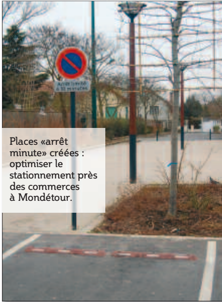
Places «arrêt minute» créées : optimiser le stationnement près des commerces à Mondétour.

Au-delà des débats sur les dossiers de fond de notre ville, les conseils de quartiers sont également des lieux d'échange et de collecte d'information sur nos quartiers. Des demandes qui font l'objet d'un rapport aux services techniques pour réalisation, réponse ou réflexion.