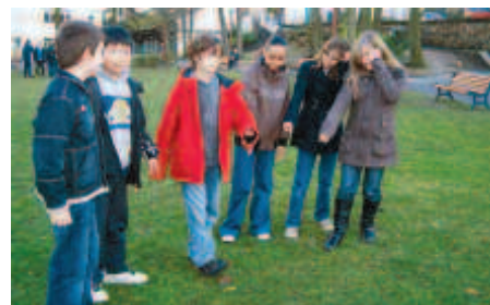
Les élus du CMJO travaillent au visuel de leur campagne "déjections canines".

P. 10 / • Associations : maraude de la Croix Rouge française