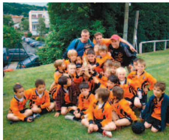
Les minis poussins (- de 9 ans) du club de rugby d'Orsay, grand vainqueurs du tournoi 2008.