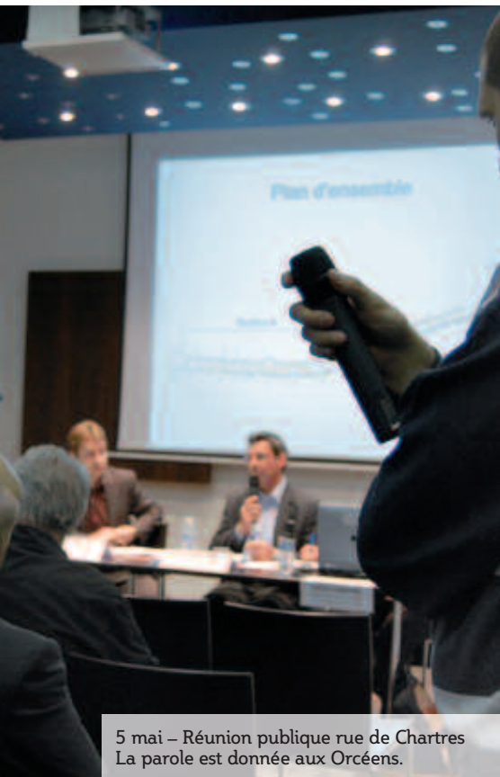
5 mai – Réunion publique rue de Chartres La parole est donnée aux Orcéens.