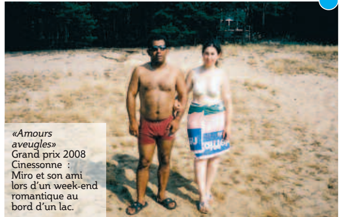
«Amours aveugles» Grand prix 2008 Cinessonne : Miro et son ami lors d'un week-end romantique au bord d'un lac.

Un palmarès à partager localement avec la MJC et le cinéma Jacques Tati, membre du réseau Cinessonne, qui nous offrent chaque année à Orsay, ce moment fort du cinéma européen.