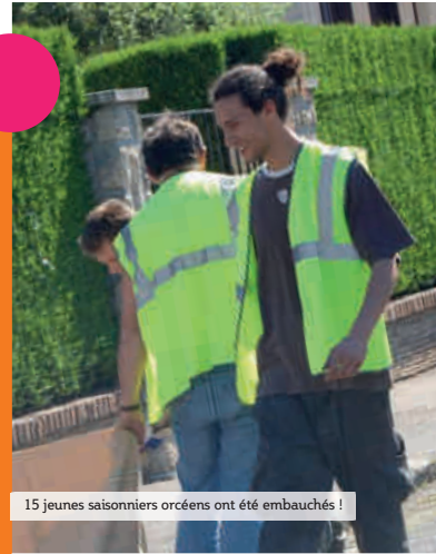
15 jeunes saisonniers orcéens ont été embauchés !

> service des sports (en partenariat avec l'office municipal des sports) : 01 60 92 81 31 secretariatsports@mairie-orsay.fr