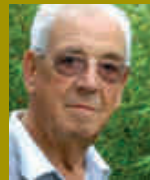
JEAN VILPOIX QUARTIER DU LE GUICHET

"Il ne faut pas laisser la voie publique se détériorer, sous prétexte de respect