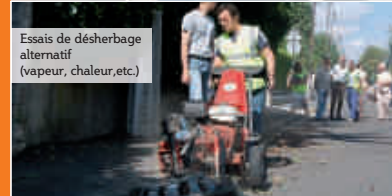
Essais de désherbage alternatif (vapeur, chaleur, etc.)