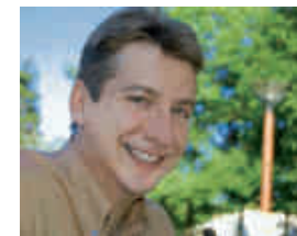
par David Ros

un nouveau magazine, un nouvel élan pour Orsay !