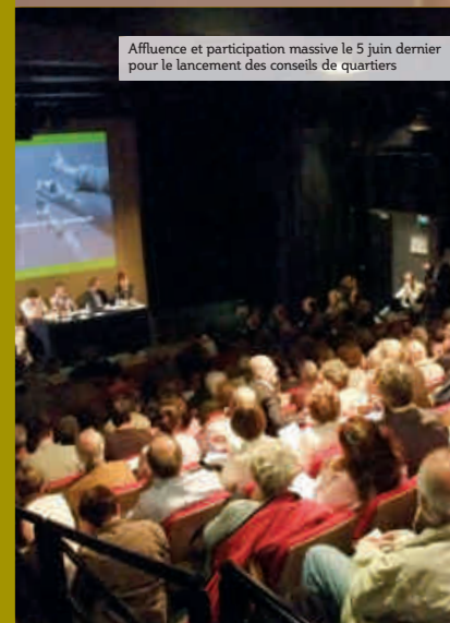
Affluence et participation massive le 5 juin dernier pour le lancement des conseils de quartiers