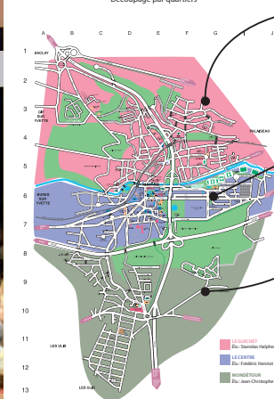
ORSAY / LES CONSEILS DE QUARTIERS Découpage par quartiers

RENDEZ-VOUS DÈS LE MOIS D'OCTOBRE POUR LES PREMIERS CONSEILS DE QUARTIER.