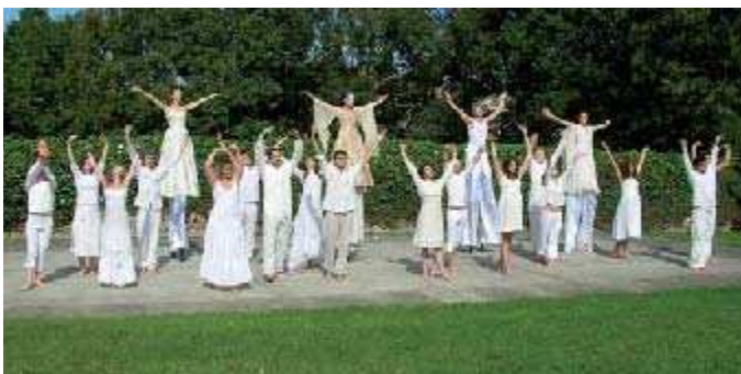
"Le spectacle à remonter le temps" , un spectacle itinérant spécialement conçu pour le site de la Bouvêche par l'école d'acteurs Ange Magnétic Théâtre, le samedi 23 septembre.