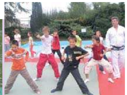
Le 16 septembre, ils étaient nombreux, petits et grands à venir essayer les multiples activités sportives proposées à l'occasion de la Fête du Sport .