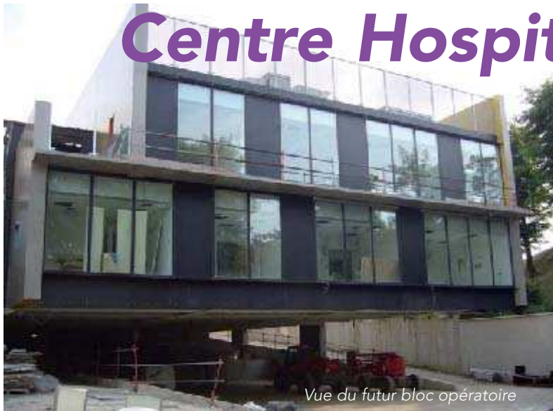
Vue du futur bloc opératoire