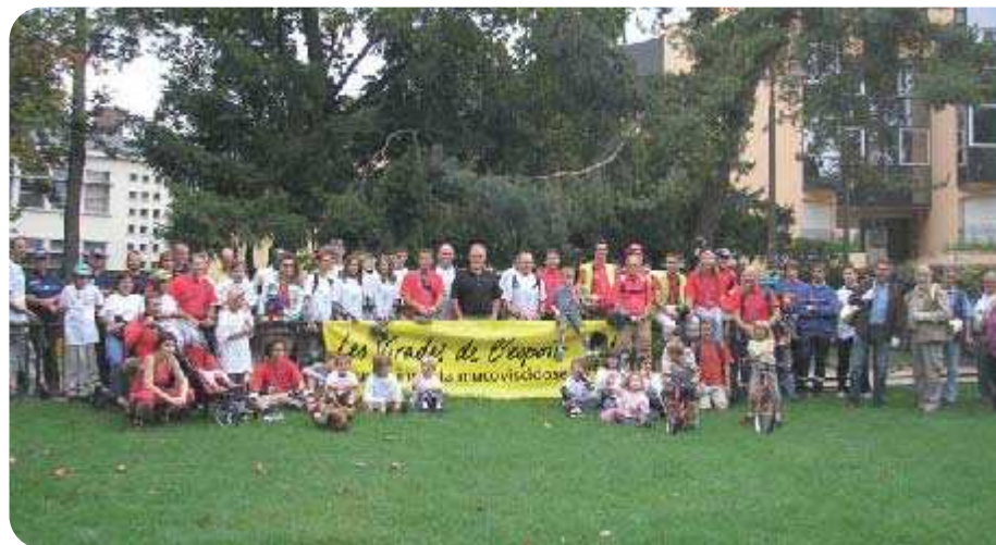
2 ème édition à Orsay de la rando-rollers , "Les Virades de l'espoir", organisée par l'association nationale "Vaincre la mucoviscidose", qui a ainsi pu collecter des fonds au travers des dons effectués par les participants.