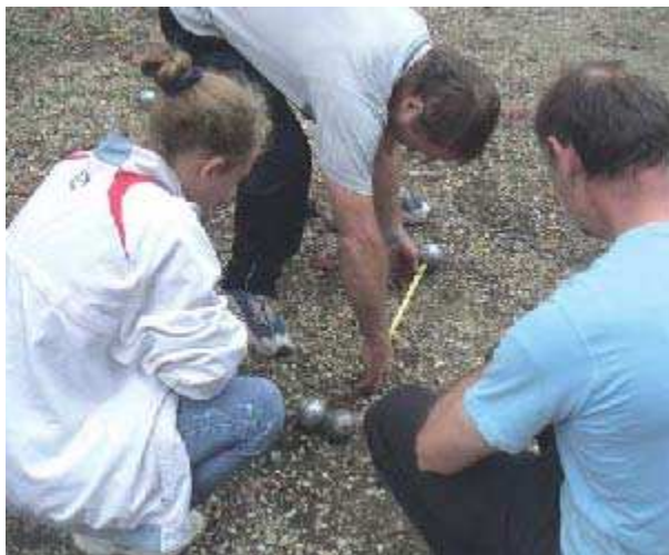
Concours annuel et amical de pétanque organisé par la FNACA (Fédération Nationale des Anciens Combattants en Algérie-Maroc-Tunisie) au Parc East-Cambridgeshire, samedi 23 septembre.