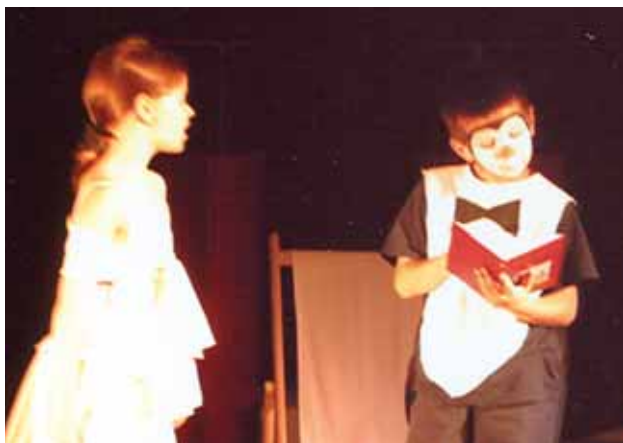
Les élèves de CE2 de Mme Deroubaix et de M. Maréchal à l'école de Mondétour ont triomphé lors de leur spectacle "Le long voyage du pingouin vers la jungle" fin juin.