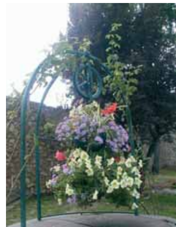
↑ Puits de la Bouvêche ← Carrefour rue Racine et rue Florian

Merci à tous !... et à l'année prochaine.