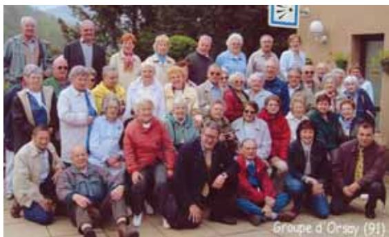
Sortie de nos anciens dans le Rouergue, à Saint-Sernin-sur-Rance, du 11 au 19 mai 2004.