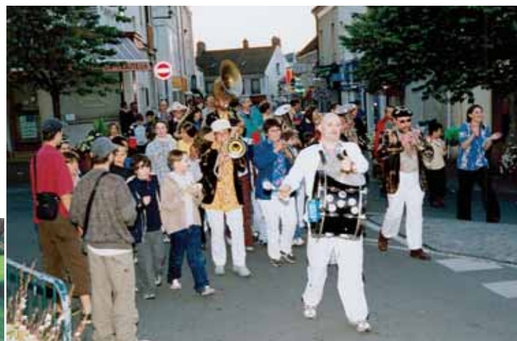
Grande fête de la musique cette année à Orsay avec un programme exceptionnellement varié. Il y en avait pour tout le monde, le 21 juin et dans tous les quartiers.