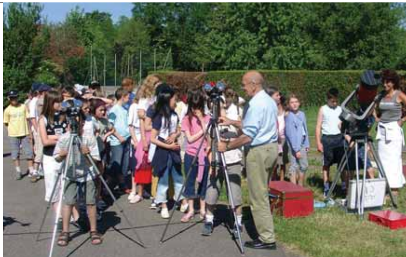
Sur invitation de l'association Astronomique de la Vallée, nombreux étaient les jeunes élèves orcéens à venir observer l'éclipse soleil/Vénus le 8 juin dernier.