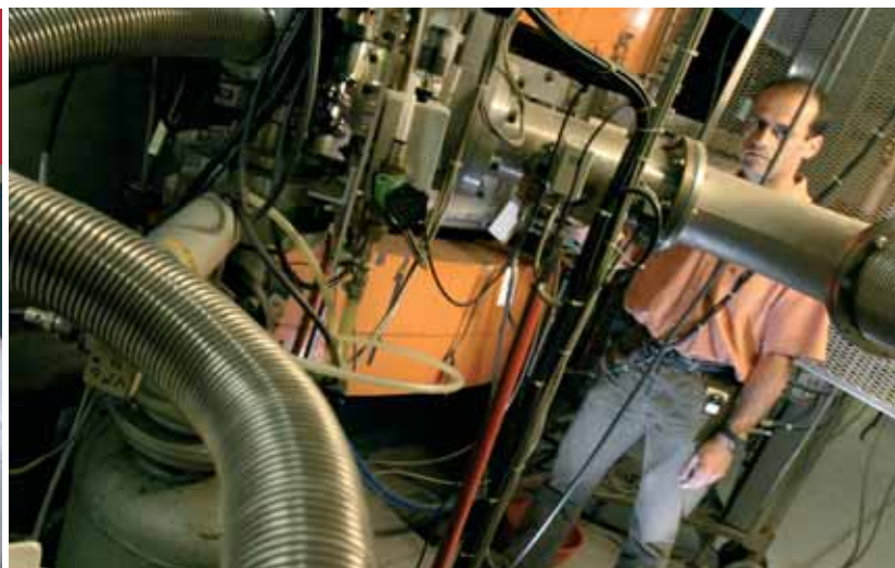
Vue de l'accélérateur de protons

Tout a commencé en 1954. Cette année-là, Irène et Frédéric Joliot-Curie construisent un accélérateur de physique nucléaire capable de produire des protons de 200 MeV. Ce synchrocyclotron est utilisé jusqu'en 1989 à des fins de recherche fondamentale en physique... jusqu'à ce que l'Assistance Publique/Hôpitaux de Paris, le centre René Huguenin, les Instituts Gustave Roussy et Curie décident, ensemble, en 1991, d'installer à Orsay autour de cet accélérateur, un Centre de Protonthérapie (CPO). L'idée de ces quatre partenaires était d'adapter ce synchrocyclotron en vue d'une application médicale dans le cadre d'un réseau hospitalier.