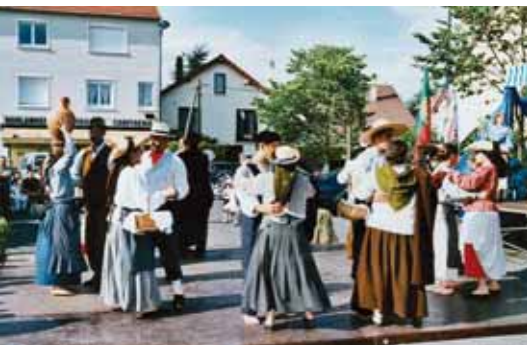
Fête du Portugal le 27 juin à Mondétour.