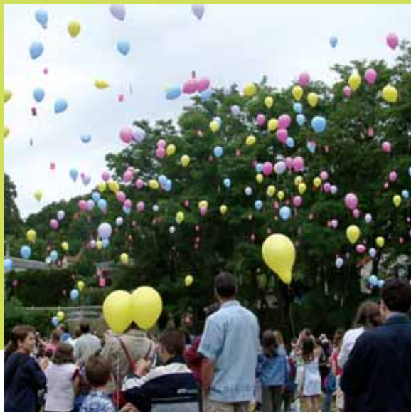
Fête de l'école élémentaire du Guichet, le 26 juin.