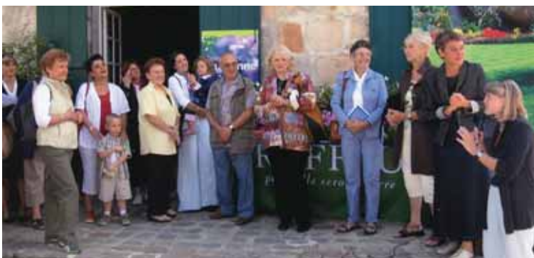
Journée des Associations, le 12 septembre avec remise du prix du concours de fleurissement.