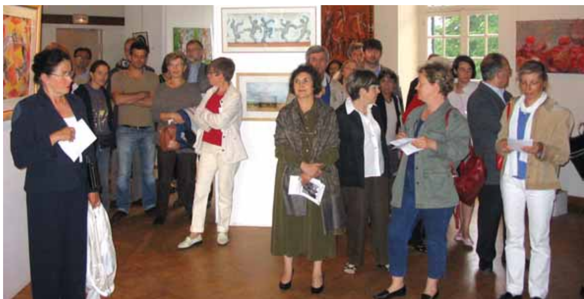
L'exposition municipale a eu lieu du 26 mai au 4 juin. Cette année, le thème était « Rythmes ».