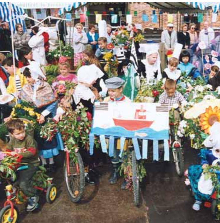
La Bretagne était présente à la fête des fleurs de Mondétour le 23 mai et, comme chaque année, fut un grand succès !