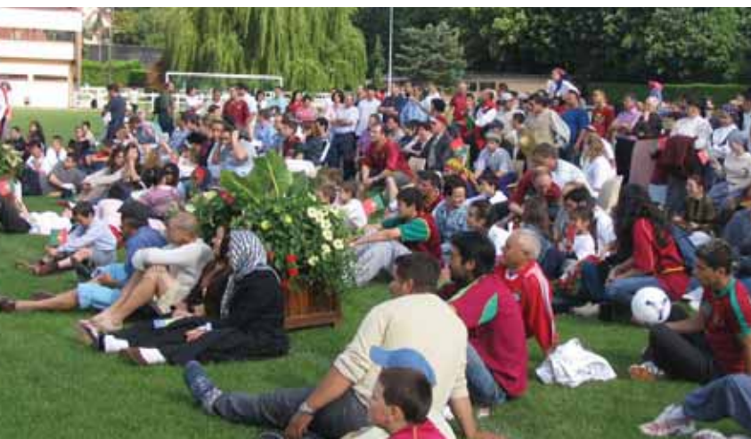
Les Orcéens sont venus nombreux assister à la retransmission en direct sur écran géant du match d'ouverture de l'Euro 2004, Portugal-Grèce, le 12 juin dernier au stade.