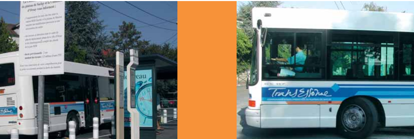
Gare du Guichet à Orsay