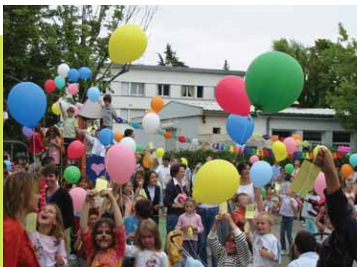
Fête de l'école de Mondétour le 26 juin.